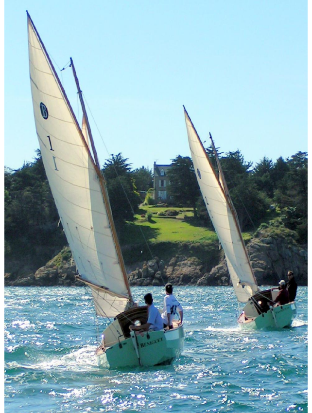
Belle sortie à 2 aux Ebihens

visible de l'extérieur du bateau est d'une grande efficacité. Les tables de carré ou de cockpit, amovibles, tout comme le rangement de godille dans la cabine vous rendront la navigation aussi agréable que les escales.